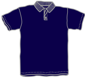
ドライタイプ ドライボタンダウンタイプ ポリエステル100%