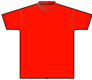
ドライタイプ ポリエステル100%